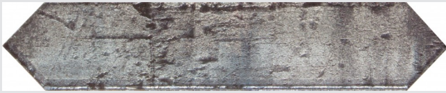
187846 Deluxe Silver 6.5x33.0 cm./2.6"x13" D461 8mm